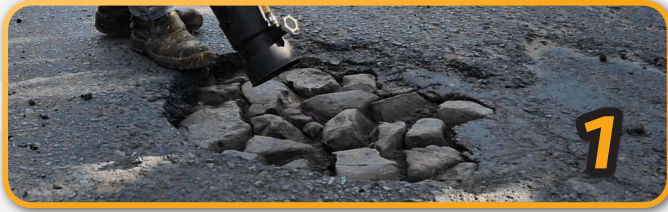
1 Limpieza del bache a ser reparado