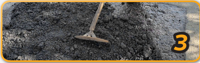
3 Aplicación y distribución del producto en frío