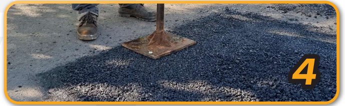
4 Finalización con compactación manual